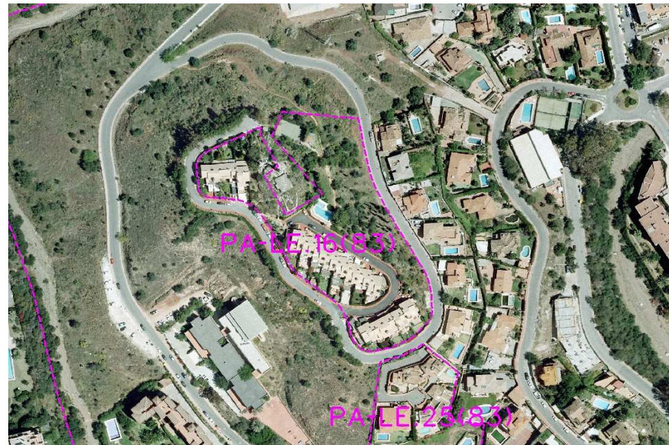
Ordenación Pormenorizada Completa

1.- Ordenanzas de Aplicación: UAS-3 (PR)